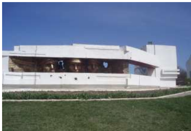
Национальный мемориальный комплекс «Высота маршала И.С. Конева»