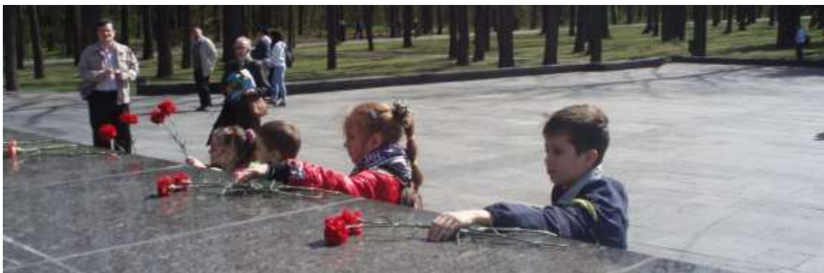
Харьковский мемориальный комплекс Славы