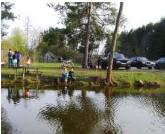
Село Соколово: Музей боевого братства, монумент «Братство по оружию», база отдыха