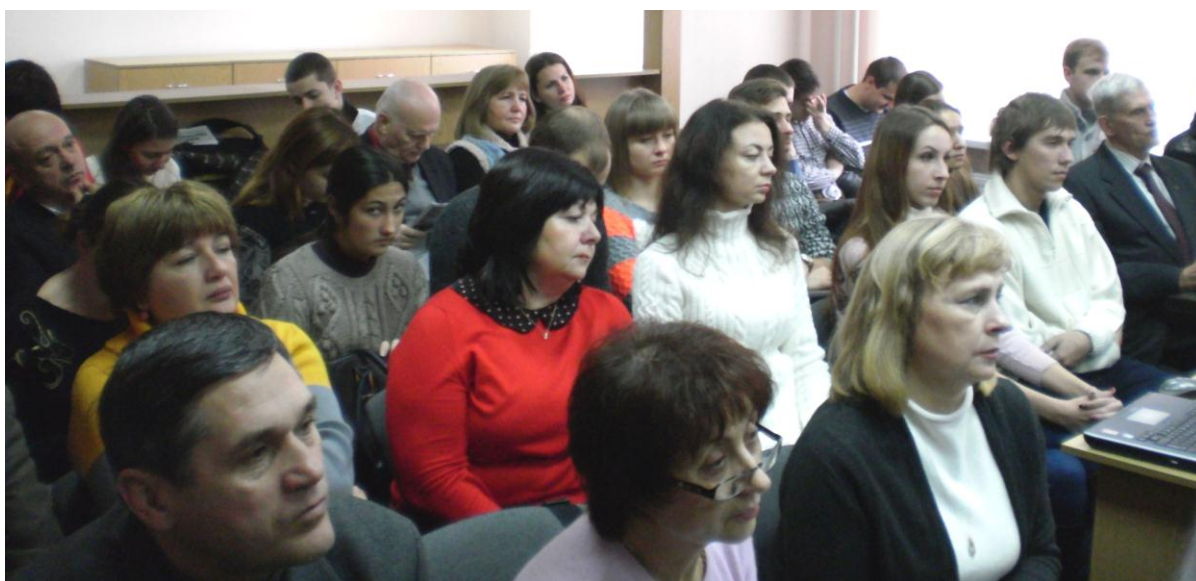
Докладчики и участники Городского межвузовского научно-практического семинара «Философия в современном мире»