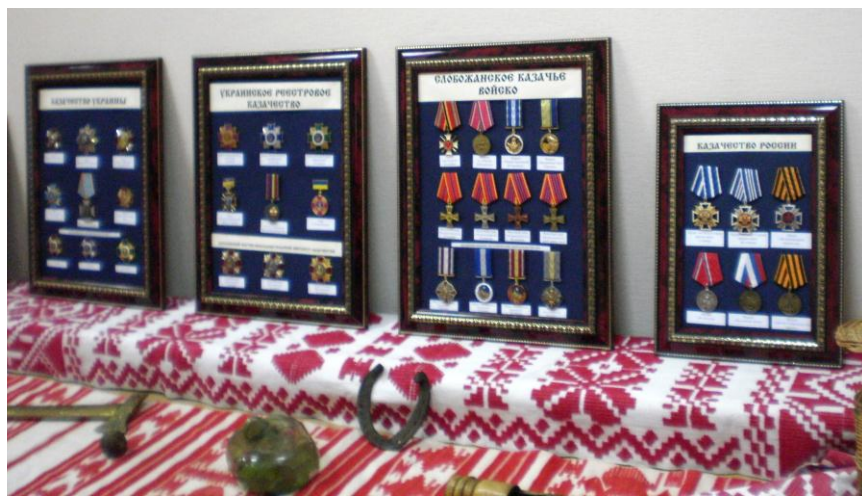
Експозиція етнографічного музею «Сокровища Слобожанщини» імени Г. Хоткевича