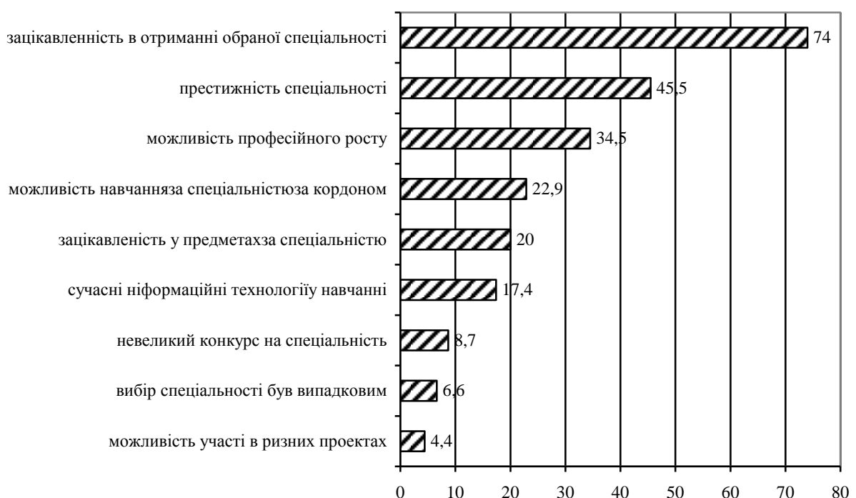
Рисунок 2 – Розподіл відповідей на питання «Що впливало на Ваш вибір спеціальності?» (у %)

ників, що визначили своє зацікавлення у вивченні соціально-гуманітарних дисциплін. Тим більше, що у порівнянні з минулими роками показники рейтингів для цієї позиції в опитуванні були значно менші. Так у 2014-2015 роках ця позиція мала 4-й ранг, а у 2016 році – він був 6-м. Стабільно, перше місце віддається знанням саме зі своєї спеціальності, а знанням необхідним для створення власного бізнесу протягом 2014-2016 років віддавалося друге місце. Базові знання з усіх дисциплін протягом 2014-2016 років мали третє місце та тільки у 2017 році знизили показник до четвертого рангу. Стабільність демонструють показники рейтингів відповідей про прагнення до занять наукою – 7 місце протягом 2014-2017 років та восьме рангове місце для відповіді про прагнення займатися наукою (за цей же період).