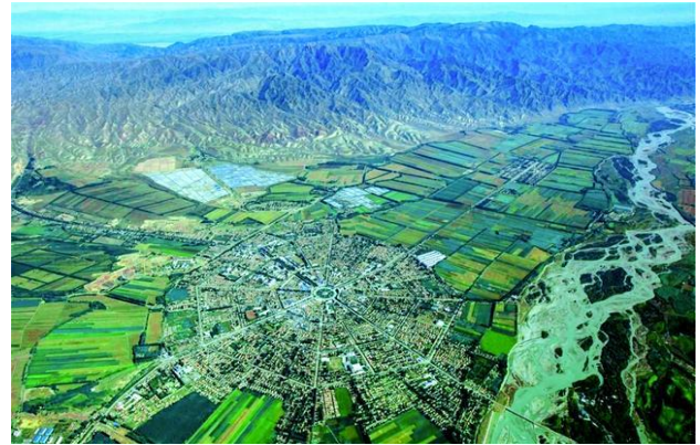
Рис. 4. Дневной город-Багуа (Синьцзян)

Принцип «с помощью Ци». «Ци» является источником всего сущего. Идея «Фэн Шуй» предлагает строить дом в оживлённых местах, там, где существует «Ци». В такой обстановке растения процветают, и люди могут жить здоровой и долгой жизнью.