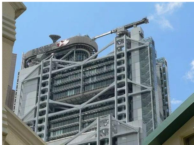
Рис.8. Здание Банк HSBC в Гонконге

Здание Банка HSBC в Гонконге (The Hongkong and Shanghai Banking Corporation Limited) находится на противоположной стороне от здания Банка Китая в Гонконге. Для того чтобы обеспечить хороший «Фэн Шуй», на вершине здания были установлены две пушки. Стволы пушек были длиной более десяти метров. Стволы пушек прямо направлены на здание Банка Китая, чтобы противостоять «ШаЦи» (злым влияниям) от здания Банка Китая в Гонконге.