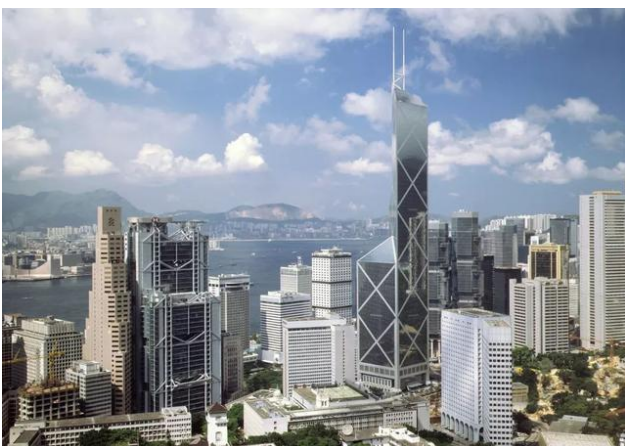
Рис.6. Здание Банка Китая в Гонконге под дневным видом

Хотя Пей Минминг поэтически описал дизайн здания Банка Китая как «молодой бамбук после дождя», символизирующий силу, надежду, крепость и предприимчивость, однако, после завершения строительства среди людей распространялись слухи, что мастер по «Фэн Шуй» сказал, что здание похоже на острый холодный нож с множеством острых углов и той же линией лезвий. Хозяева зданий, стоящих перед этими острыми углами и волнистыми линиями лезвий, начали испытывать беспокойство.