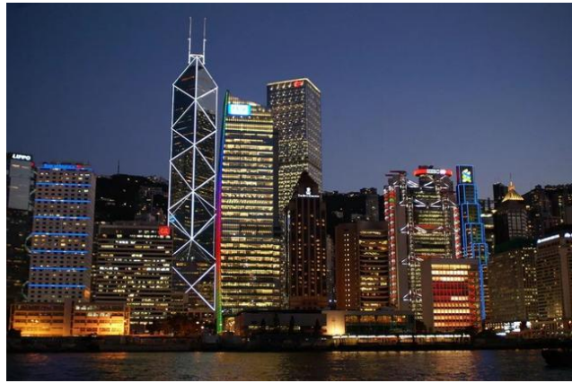
Рис.7. Здание Банка Китая в Гонконге в вечернее время

Здание Банка HSBC в Гонконге (The Hongkong and Shanghai Banking Corporation Limited) находится на противоположной стороне от здания Банка Китая в Гонконге. Для того чтобы обеспечить хороший «Фэн Шуй», на вершине здания были установлены две пушки. Стволы пушек были длиной более десяти метров. Стволы пушек прямо направлены на здание Банка Китая, чтобы противостоять «ШаЦи» (злым влияниям) от здания Банка Китая в Гонконге.