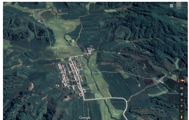
Рис. 3. Рельефный план родного села у автора (по автору это по «Фэн Шуй»)

Классификация «Фэн Шуй». «Фэн Шуй» по рельефу означает, что, как следует из названия, необходимо наблюдать за рельефом и окружением постройки, за планировкой (устройством) мебели для комнатных помещений и т. д., посредством сочетания внутренней и внешней частей, чтобы обеспечить жильцов возможностью жить безопасно, уютно и радостно. Многие из знакомых высказываний, которые всем известны, такие как «Шань Хуань Шуй Бао» (окружающие какую местность горы и реки), «Цзинь Чэнь Хуань Жао» (окружающие крепость горы и реки), «Цзо Бэй Чао Нань» (быть