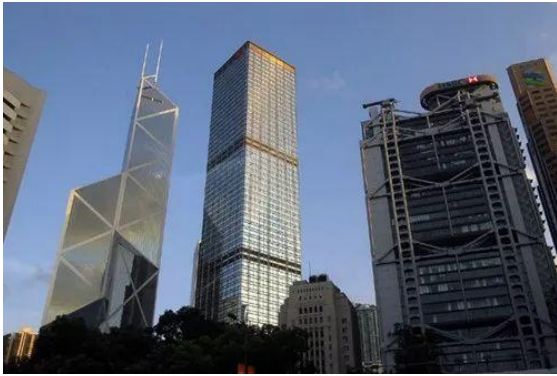
Рис. 9. Здание Банка Китая в Гонконге (слева), Корпорация «Река Янцзы» (в середине), Здание Банк HSBC в Гонконге (справа)

Выводы. Целью «Фэн Шуй» является тщательное и всестороннее изучение и понимание природной среды с рациональным её использованием, создание хорошей среды обитания, достижение наилучшей гармонии между человеком и природой. Автор считает, что на протяжении всей истории развития «Фэн Шуй», поскольку он укоренён в специфической почве китайской культуры, он может содержать определенные метафизические элементы и таинственные цвета, но нельзя отрицать то, что он также обладает определенной практичностью и научностью. Древний «Фэн Шуй» вместе с китайской историей прошёл много тысячелетий, и его эффект и культура были отражены во всех аспектах жизни. Поэтому, если мы собираемся полностью отрицать его, следует учесть, что Южная Корея и Япония хотят подать заявку на признание «Фэн Шуй» «Мировым нематериальным культурным наследием». Это значит, что нам следует рассмотреть и анализировать его более всеобъемлющими методами. Как отметил британский ученый Нидхэм в труде «Наука и цивилизация Китая»: «Фэн Шуй» полезен для китайцев... Хотя он, безусловно суверен в некоторых других аспектах, однако он всегда содержит эстетическую красоту в садах, полях, жилых домах и посёлках Китая».