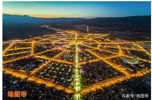
Рис. 5. Ночной город-Багуа (Синьцзян)

Примеры применения «Фэн Шуй». В общем, там, где соблюдены принципы «Фэн Шуй», – хорошее место, жизнь в котором способствует людям работать удачно и наживать состояние, и даже содействовать будущим поколениям жить богато, быть выдающимися и благословенными. В Китае есть шесть известных городов, построенных согласно «Фэн Шуй»: город Багуа (провинция Синьцзян), Куньмин (Юньнань), Вэньчжоу (Чжэцзян), Яньчэн (Хунань), Шэньчжэнь (Гуандун) и Пекин.