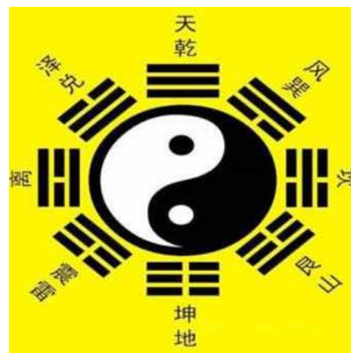
Рис. 1. Круг – символ изначального эфира с делением на символы «Инь» (тёмный), «Ян» (светлый) и восемь триграмм (Карта «Тайцзи,ИньЯниБагуа»)

Теория «Ци» – основная идея культуры «Фэн Шуй». На самом деле, фундаментальная цель изучения «Фэн Шуй» – это изучение «Ци». «Ци» – это жизненная энергия, которую нельзя увидеть или потрогать. Объяснение с материальной точки зрения: мы можем чувствовать это в соответствии с различными формами проявления. Например, мы живём, потому что дышим невидимым кислородом; к нам идёт энергичный человек, и эта жизненная сила отражается в его возрасте, одежде, шагах и выражении лица.